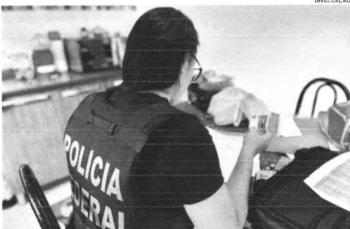
Os policiais federais cumprem 13 mandados de busca e apreensão no Distrito Federal, São Paulo, Maranhão, Piauí e Tocantins

A Polícia Federal deflagrou, na manhã desta quinta-feira (16), a operação Cyber Impetum tendo como alvo um grupo suspeito de fraudes bancárias, que somam mais de R$ 1,9 milhão, contra contas de entidades privadas e órgãos do governo. As irregularidades seriam contra o Banco do Brasil. Os agentes cumprem 13 mandados de busca e apreensão no Distrito Federal, São Paulo, Maranhão, Piauí e Tocantins. Também são cumpridos ordens judiciais de bloqueio de bens e valores de alvos da operação, com o objetivo de recuperar o montante desviado. No Maranhão, foram cumpridos 13 mandados – todos em São Luís.