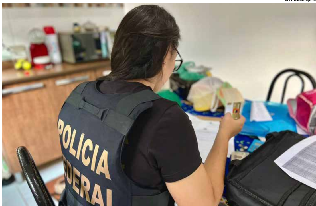
Os policiais federais cumprem 13 mandados de busca e apreensão no Distrito Federal, São Paulo, Maranhão, Piauí e Tocantins

De acordo com as investigações, os suspeitos obtinham os dados bancários das vítimas, inclusive de municípios, e realizavam operações pela internet, efetuando transferências eletrônicas para diversas outras contas. Segundo a Polícia Federal, foram identificados acessos em contas de clientes que, até o momento, não registraram boletins de ocorrência, o que indica que o dinheiro desviado pelo grupo pode superar o valor apurado pela PF. Os alvos são investigados por organização criminosa, furto qualificado mediante fraude em