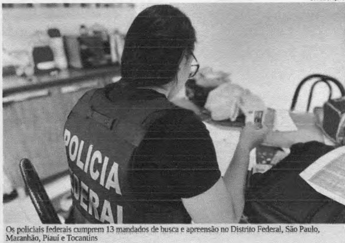
Os policiais federais cumprem 13 mandados de busca e apreensão no Distrito Federal, São Paulo, Maranhão, Piauí e Tocantins

Segundo a Polícia Federal, foram identificados acessos em contas de clientes que, até o momento, não registraram boletins de ocorrência, o que indica que o dinheiro desviado pelo grupo pode superar o valor apurado pela PF. Os alvos são investigados por organização criminosa, furto qualificado mediante fraude em