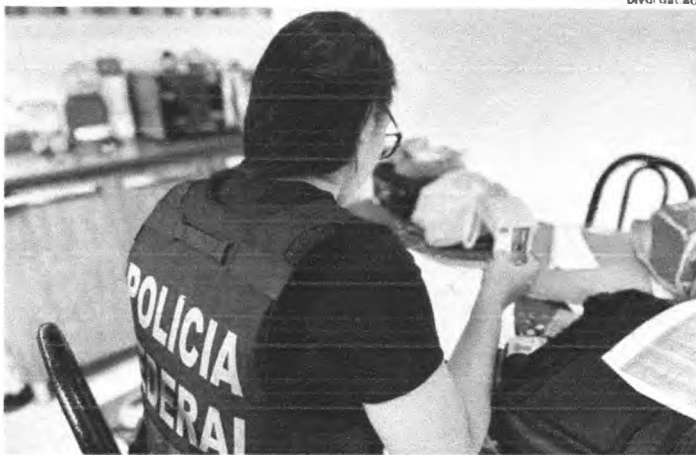
Os policiais federais cumprem 13 mandados de busca e apreensão no Distrito Federal, São Paulo, Maranhão, Piauí e Tocantins

A Polícia Federal deflagrou, na manhã desta quinta-feira (16), a operação Cyber Impetum tendo como alvo um grupo suspeito de fraudes bancárias, que somam mais de R$ 1,9 milhão, contra contas de entidades privadas e órgãos do governo. As irregularidades seriam contra o Banco do Brasil. Os agentes cumprem 13 mandados de busca e apreensão no Distrito Federal, São Paulo, Maranhão, Piauí e Tocantins. Também são cumpridas ordens judiciais de bloqueio de bens e valores de alvos da operação, com o objetivo de recuperar o montante desviado. No entanto, foram cumpridos 13 mandados – todos em São Luís.