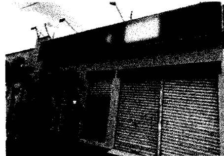
A festa, no estilo rave, seria realizada em um imóvel localizado às margens da MA-201