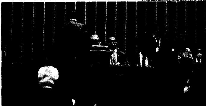
Deputados e senadores, em sessão conjunta, deliberaram sobre vetos do presidente da República a projetos aprovados pelo Congresso Nacional, neste e ano passado

O projeto de Lei Orçamentária para 2022 foi o que recebeu maior quantidade de vetos: 235 dispositivos. Um deles é que trata do corte de R$ 3,1 bilhões em despesas aprovadas em dezembro (São RS 1,3 bilhão em emendas comissão e R$ 1,8 bilhão em despesas discricionárias). O corte, segundo o governo foi "por inconstitucionalidade e contrariaridade ao interesse público". No caso da chamada de BR do Mar, os pontos vetados são os que exigem das embarcações fretadas tripulação composta de, no mínimo, dois terços de brasileiros em cada nível técnico do oficialado, incluídos os graduados ou subalternos, e em