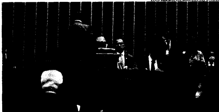
Deputados e senadores, em sessão conjunta, deliberaram sobre vetos do presidente da República a projetos aprovados pelo Congresso Nacional, neste e ano passado

No caso da chamada de BR do Mar, os pontos vetados são os que exigem das embarcações fretadas tripulação composta de, no mínimo, dois terços de brasileiros em cada nível técnico do oficialado, incluídos os graduados ou subalternos, e em