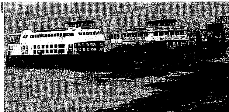
Dino editou decreto autorizando a intervenção no serviço de transporte aquaviário realizado pela Servi-Porto.