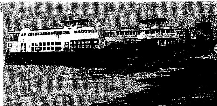
Dino editou decreto autorizando a intervenção no serviço de transporte aquaviário realizado pela Servi-Porto.